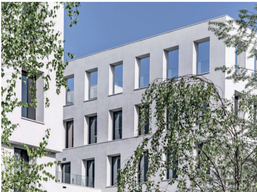
Das Prinzip 22·26 in neuer Größe BGF 18.000 m 2 Fertigstellung 2025