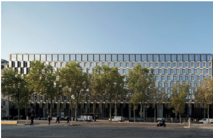
Neues Leben für ein ikonisches Gebäude BGF 50.500 m 2 , Fertigstellung 2022