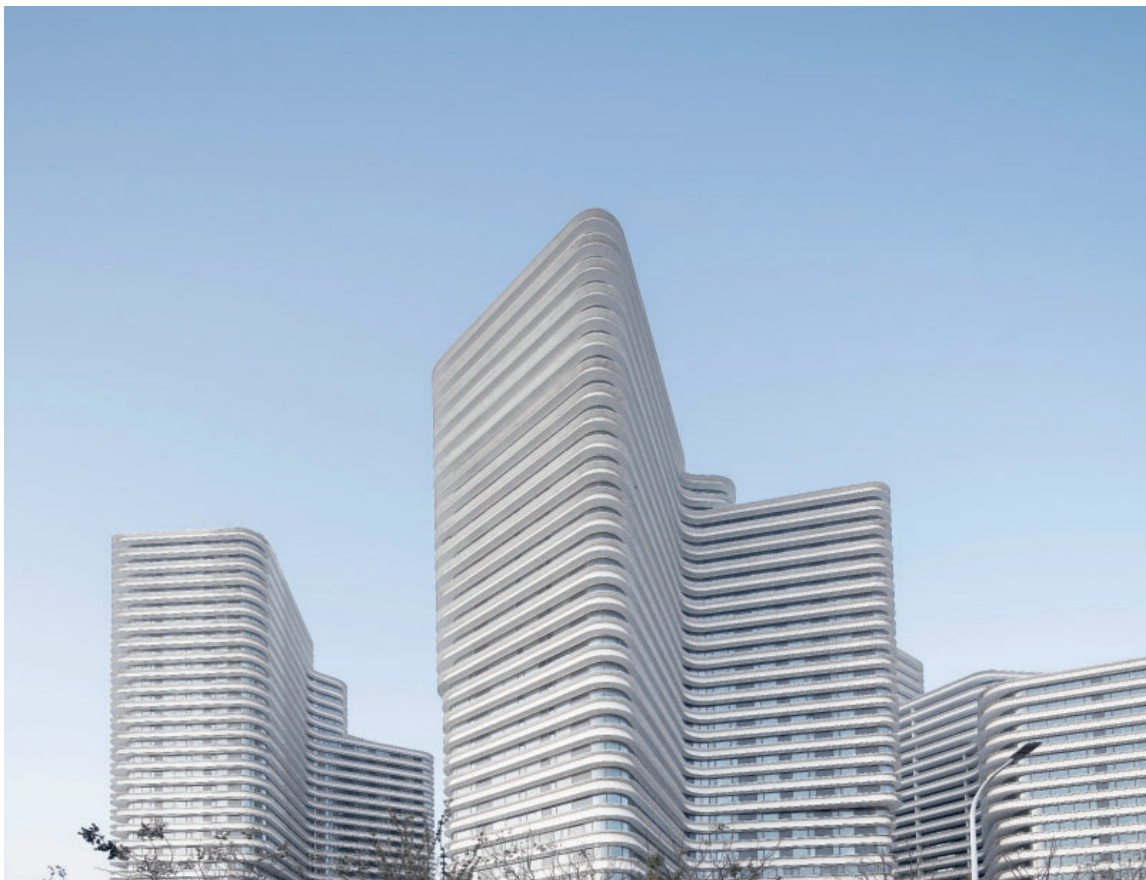
Luxuswohnungen in klug komponierten Türmen BGF 120.000 m 2 , Fertigstellung 2021

CEG Kaiyuan Street Yancheng, V. R. China